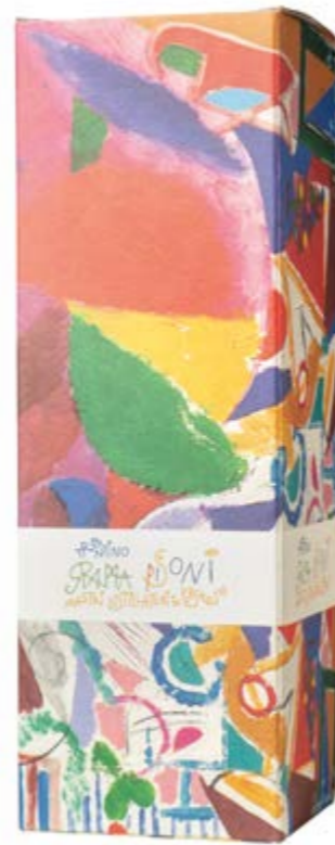
Astuccio Grappa Magnum 1,5 l