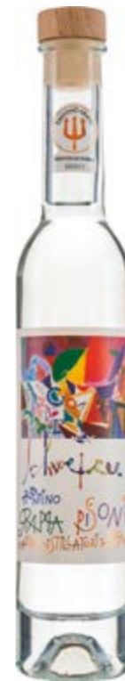
Grappa Schweizer Giovane