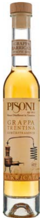
Grappa Barricata Gewürztraminer