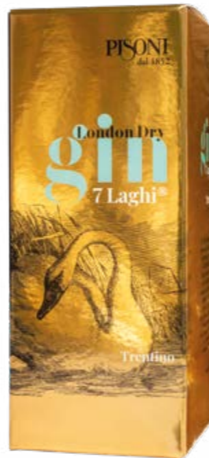
Astuccio Gin 0,70 l