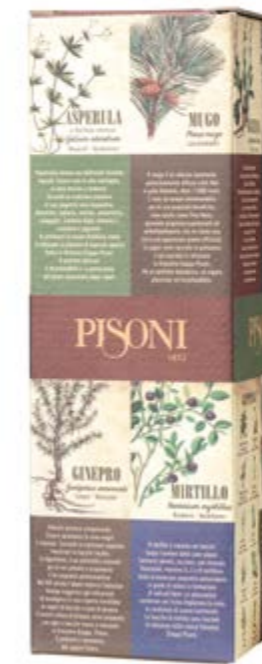
Astuccio Grappa alle Erbe 0,70 l