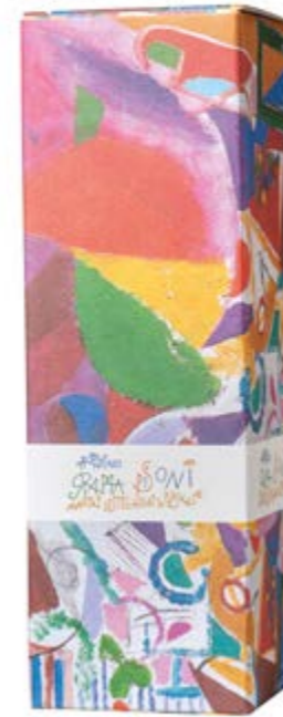
Astuccio Grappa 0,70 l