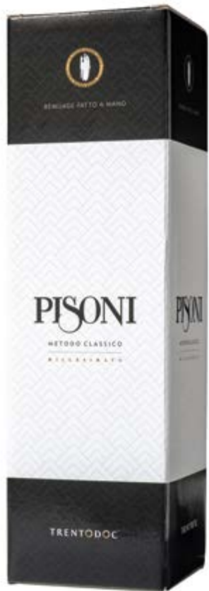
Astuccio Spumante Magnum 1,5 l