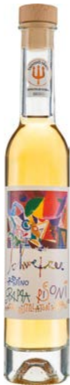
Grappa Schweizer Barricata