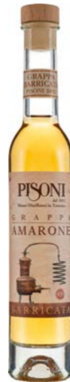
Grappa Barricata Amarone