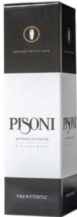
Astuccio Spumante 0,75 l