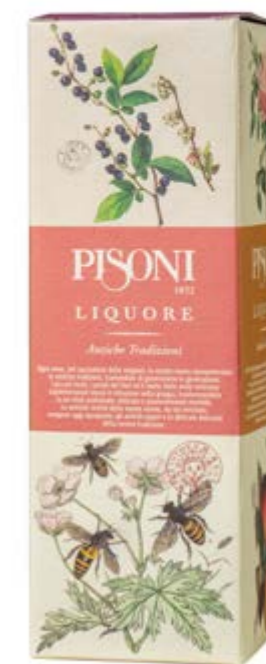
Astuccio Liquori 0,70 l